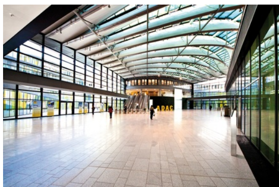
ADAC, Munich, Germany

Les zones d'accueil spacieuses et hautes de plafond ont besoin de diffuseurs capables d'envoyer l'air loin dans la pièce. Des systèmes de régulation intelligents garantissent que le flux d'air est rapidement adapté à des utilisations d'intensité variable et à des conditions climatiques variables.