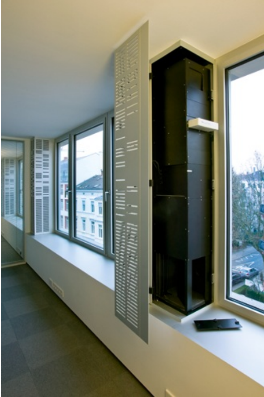
Feldbergstraße, Frankfurt/Main, Germany

Que ce soit pour de nouveaux bâtiments ou des réhabilitations, TROX a équipé de nombreux projets prestigieux avec des systèmes de ventilation décentralisés.