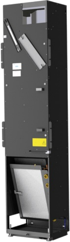
Appareil de soufflage et d'extraction d'air vertical FSL-V-ZAB avec échangeur thermique et récupérateur de chaleur. jusqu'à 42 l/s jusqu'à 150 m 3 /h B: 396 mm H: 1 800 mm T: 319 mm