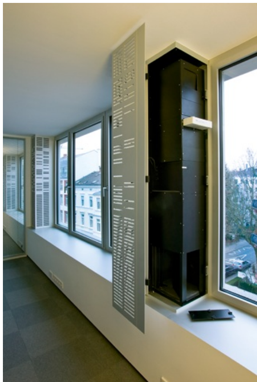
Feldbergstraße, Frankfurt/Main, Germany

Que ce soit pour de nouveaux bâtiments ou des réhabilitations, TROX a équipé de nombreux projets prestigieux avec des systèmes de ventilation décentralisés.