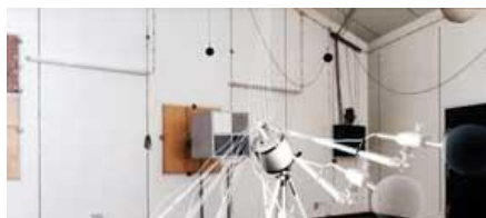
DES MESURES SUR LES SILENCES COUSTIQUES COUSTIQUE

Cela restera un facteur de réussite essentiel, même à l'ère de la numérisation.