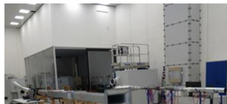
BANCS D'ESSAI TECHNOLOGIE DE RÉGULATION