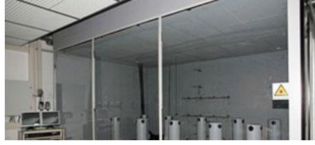
Bancs d'essai Technologie de diffusion d'