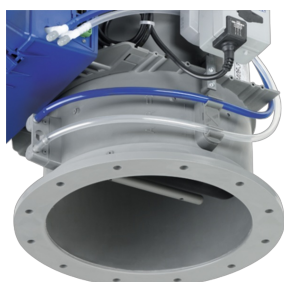
VARIANTE D'EXÉCUTION AVEC DÉFLECTEUR ET BRIDE