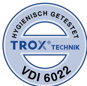
TESTÉS CONFORME À LA NORME VDI 6022