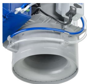
VARIANTE AVEC BUSE VENTURI ET EMBOUT MÂLE DE RACCORDEMENT CIRCULAIRE