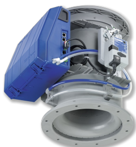
UNITÉ TERMINALE VAV, VARIANTE TVLK, AVEC BUSE VENTURI ET BRIDE