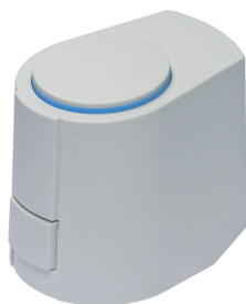
MOTEUR DE VALVE FSL- CONTROL II